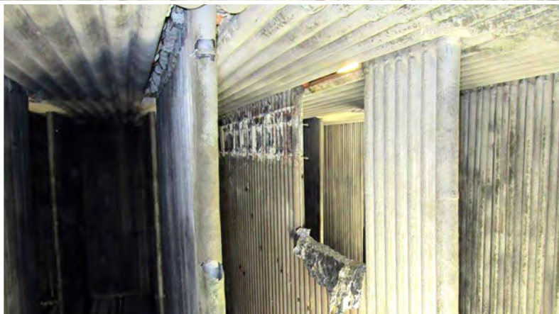
STEAG, IKW Rüdersdorf Reparatur Schottrohre Zwischenüberhitzer 2 und Überhitzer 3 2020