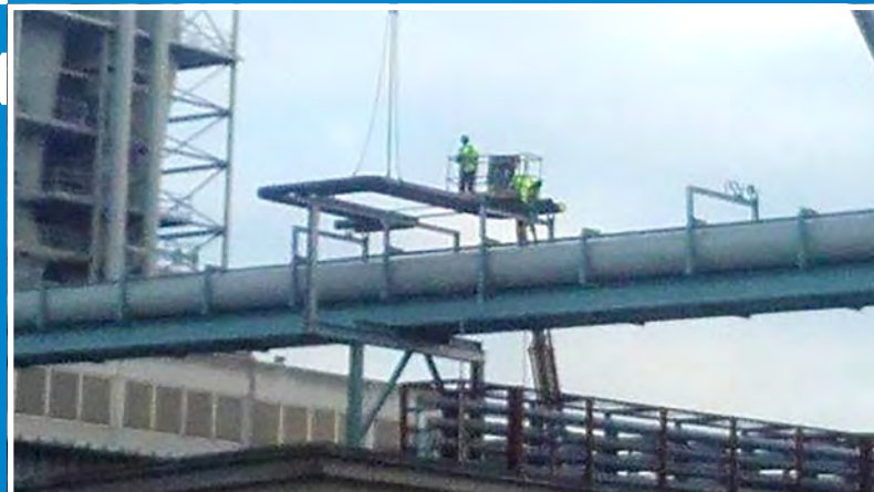
Sonae Arauco, Werk Beeskow Thermoölleitung Pumpenraum – Verlegung Rohrleitung DN 200 2020