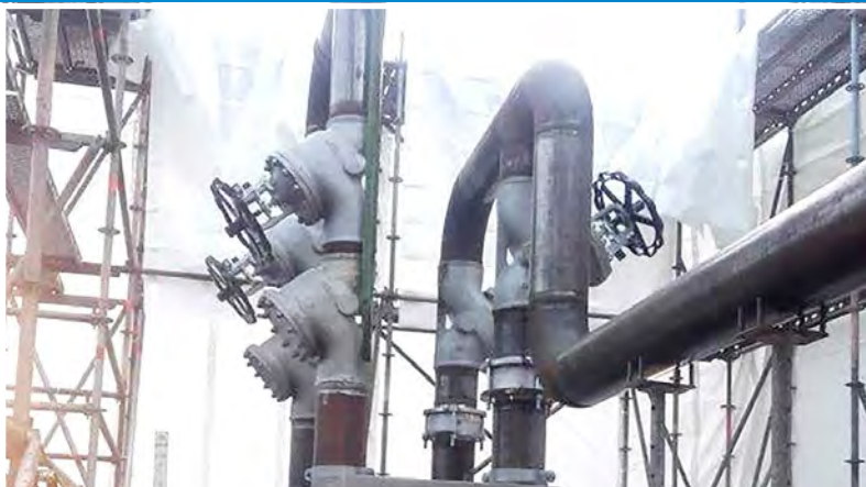
Sonae Arauco, Werk Beeskow Spanntrockner 27 m lang, ca. 6 m Durchmesser, Drittel und 2 Kammern kompletter Wechsel der Heizrohre 2017